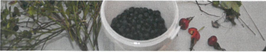
Ätliga inhemska bär presenteras

- Det är fascinerande hur vår natur med mycket skog och hav, sjöar, regn och frisk luft kan vara en överraskning för människor från andra länder, berättar Milla Lynch och Essi Niiranen.