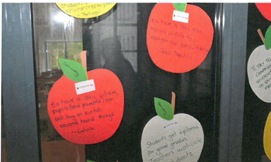
Goda idéer skrivs ner på äpplen som är symboliska för Lojo.

- Det här med att köpa begagnat och handla på lopptorg är nytt för många, medan det för oss är vardagsmat.