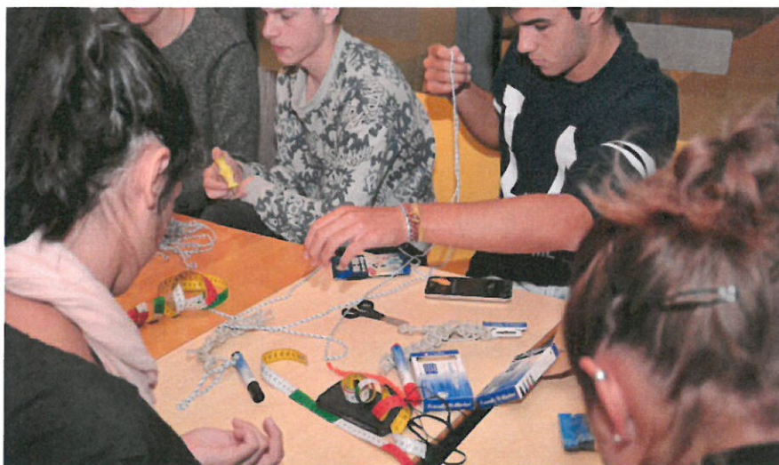
Här tillverkas armband av snöre som kan komma till nytta.

Experter har bjudits in för att informera om miljöfrågor och hållbar närhandel. Under seminariet den 7-11 september besöker man också utfärdsmål som tangerar hållbar energi- och vattenkonsumtion samt hållbart uteliv och konsumerande.